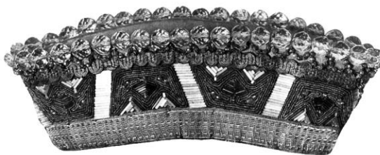
Nīcas jaunavas vainags