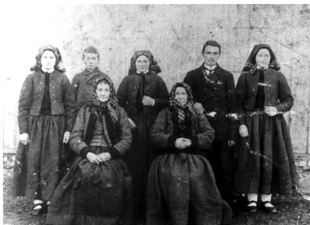
Nīcas tautas tērpi ap 1910.g.